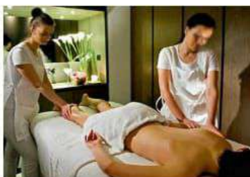
Il massaggio Il park hotel dei Cappuccini