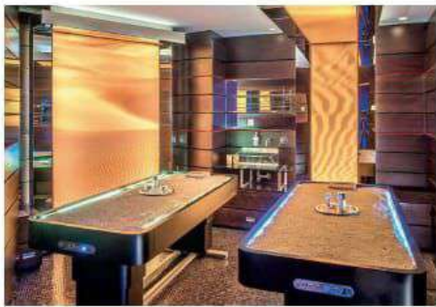
▲ Relax Una delle sale trattamenti dell'hotel Aleph e nella foto grande la piscina del Cavalieri di via Cadlolo