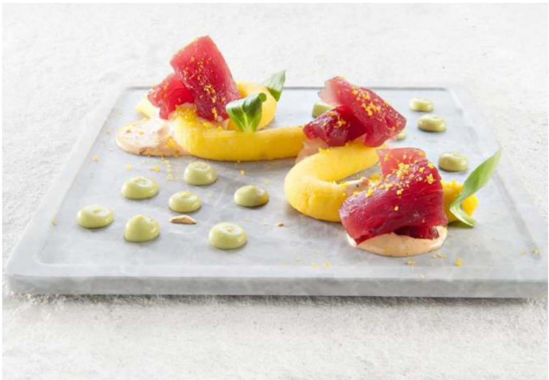
Causa di tonno Norteña (tonno, bottarga e aji amarillo)