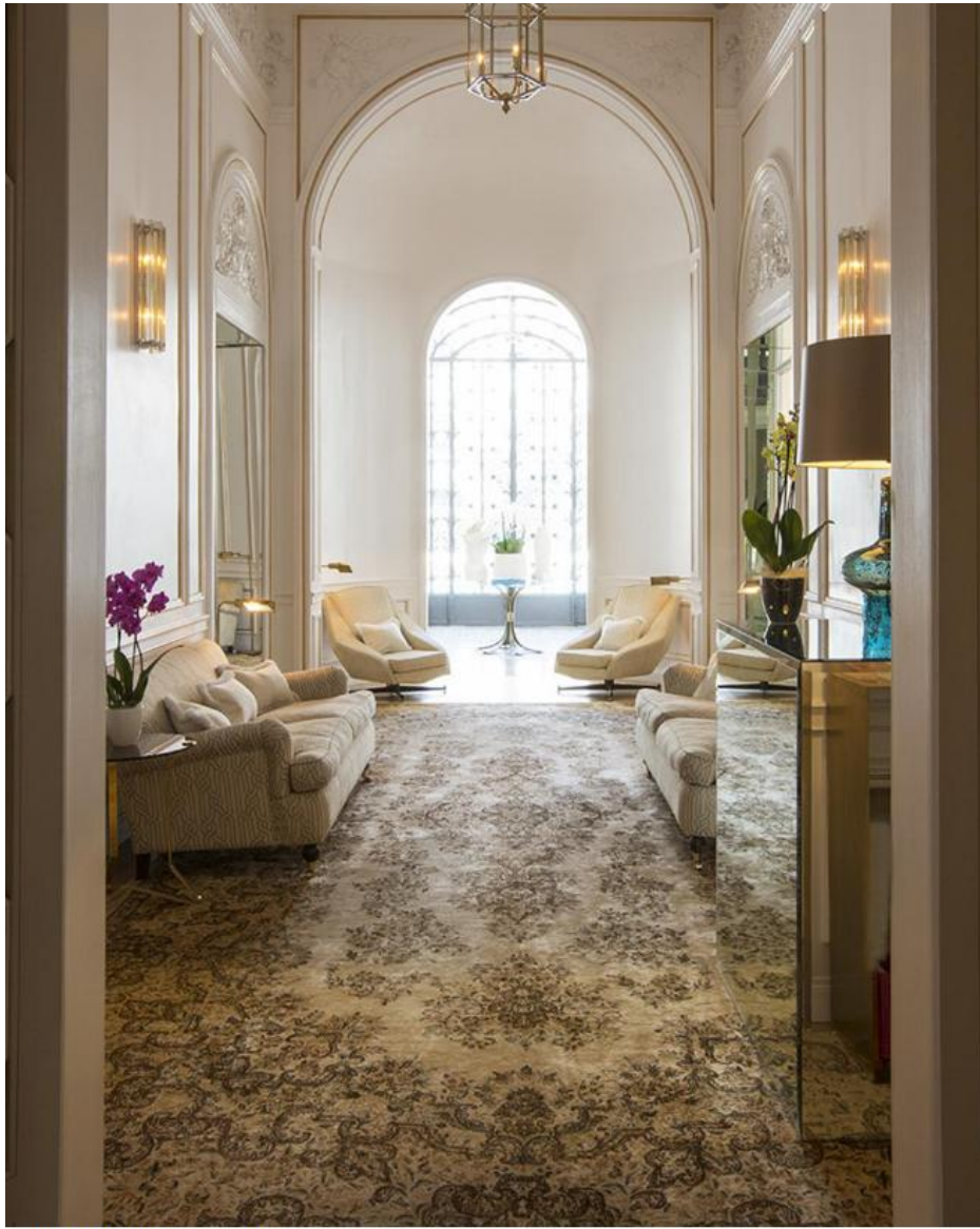
La Hall di Palazzo Dama