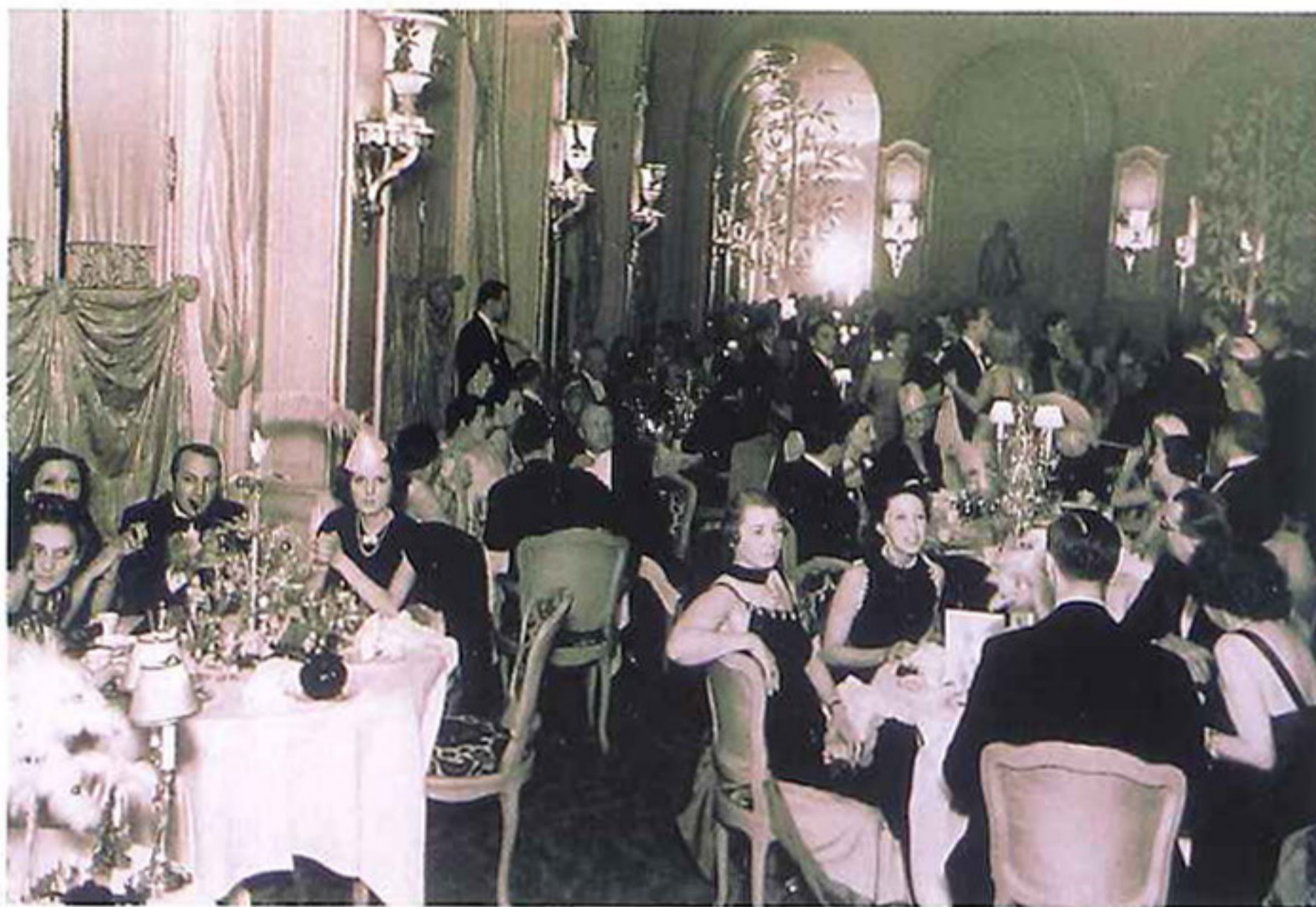
Un'immagine dagli archivi del Ritz Hotel Paris

Inaugurato il primo giugno del 1898, rinnovato negli anni '80, ai primi di giugno si potrà assistere al III atto del Ritz Hotel Paris. Nessuna rivoluzione, ma un oculato ripristino degli spazi che furono cari a Marcel Proust e Maria Callas. Depositario istituzionale dell'art de vivre, si è riappropriato di tutte le qualità degne della prestigiosa etichetta Palace. (www.ritzparis.com)