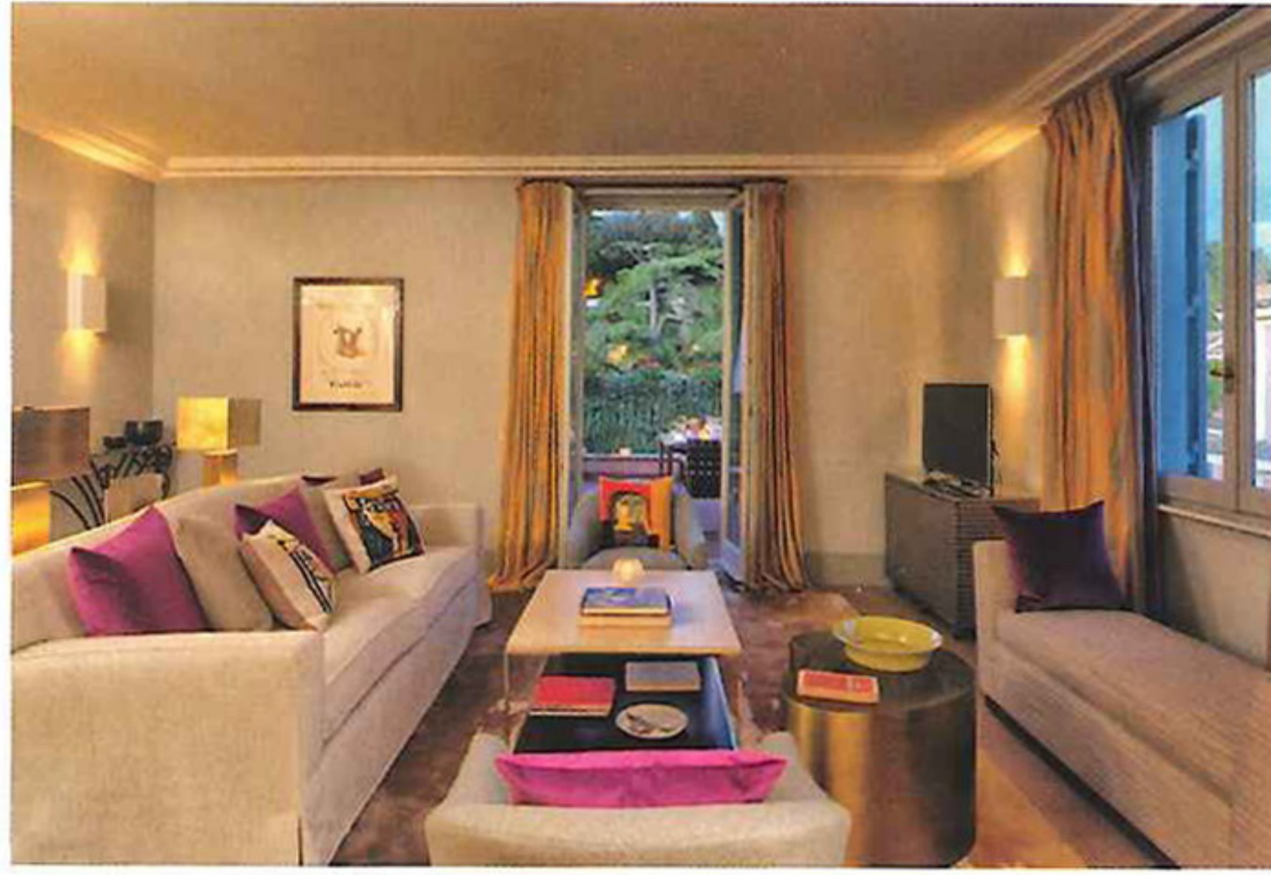
Interno della stanza "Picasso" de L'Hotel de Russie

L'Hotel de Russie, in via del Babuino a Roma, ha rinnovato le suite "Popolo" e "Picasso". «Il design è parte integrante dei nostri hotel. Un albergo progettato bene deve essere comodo, pratico e riconoscibile», spiega Olga Polizzi, co-fondatrice di Rocco Forte Hotels (di cui fa parte l'Hotel de Russie). «Entrambe sono frutto di una minuziosa ricerca di oggetti d'antiquariato tra il Church Street Market di Londra e il quartiere Sablo di Bruxelles». (www.roccofortehotels.com)