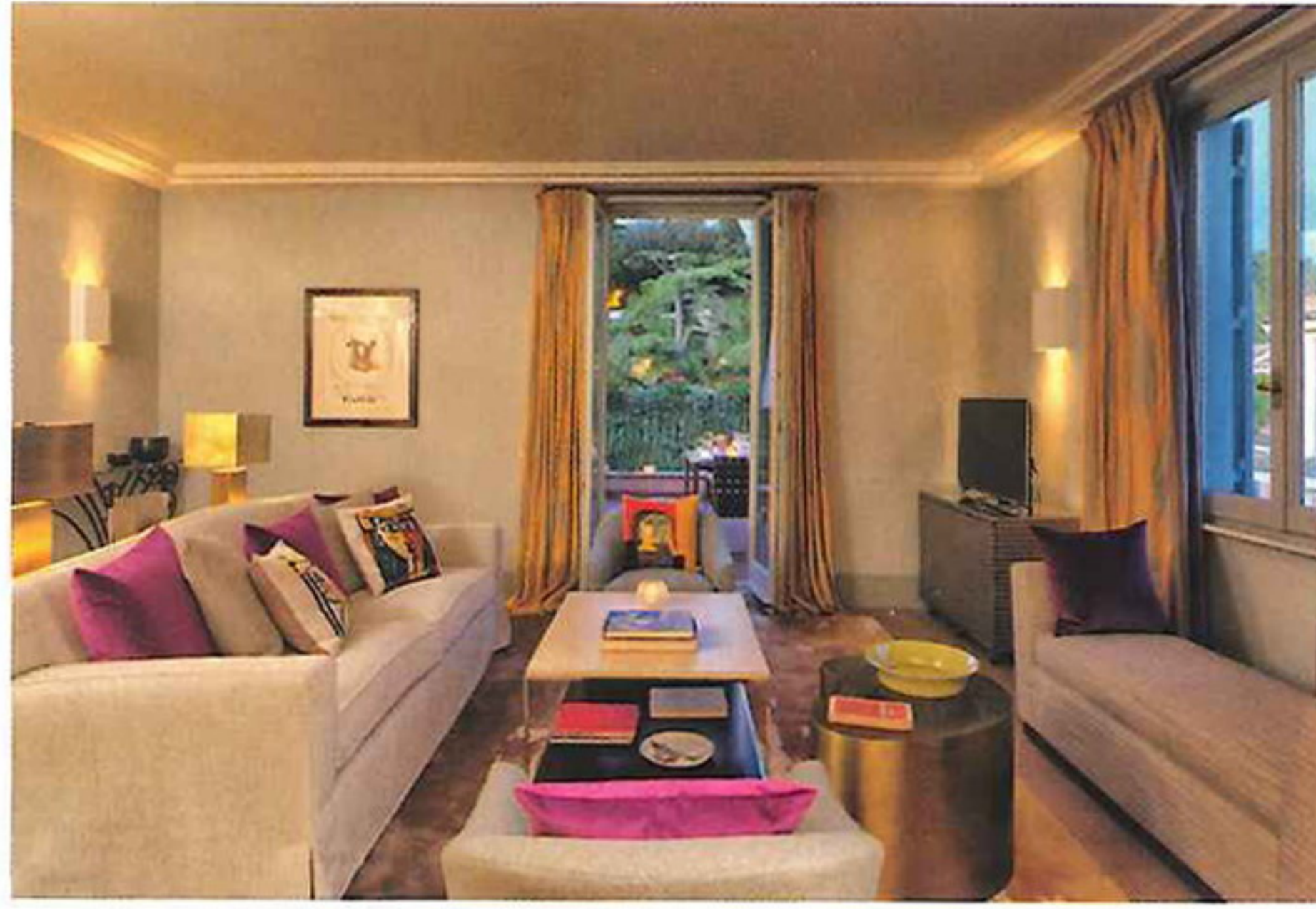
Interno della stanza "Picasso" de L'Hotel de Russie